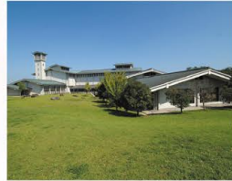
愛知県陶磁美術館 外観

重要文化財3点を含む約8,700点のコレクションを擁する、愛知県陶磁美術館内の作陶体験施設。当日の飛び入り参加もできます。