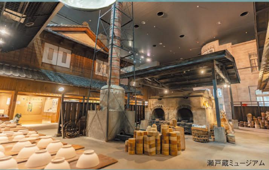
瀬戸蔵ミュージアム