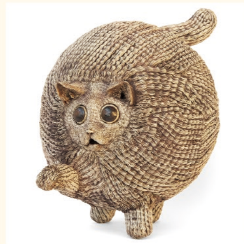
2022年度 「LUCK FAT CAT」澤村光李