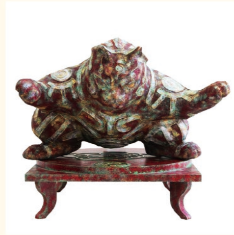
2024年度 「要 つわもの」珠羽