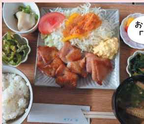
おうちごはんカフェで「ほっ」とランチ時間

日替りのおうちご飯、身体にやさしいおうちの味が食べられます。手作りお菓子、ケーキを用意してお待ちしています。