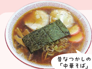
昔なつかしの「中華そば」

瀬戸市高根町2-69 ☎ 0561-85-8537 11:00~22:00 (L.O.21:00) 金・土のみ23:00まで (L.O.22:00) 火 100席 前予約可 60台 ●現金・クレジットカード・電子マネー・バーコード決済