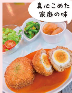
ポイント 真心こめた 家庭の味

@cafe.kitchen.mitsuki MAP | 裏表紙・D-5 瀬戸市陶原町6-10-2 ① 23時まで ☎ 090-8689-0073 ② 【昼】11:00~16:30 【夜】17:30~23:00 ③ 困日・月 ④ 15席 ⑤ 予約可 ⑥ 1台 ⑦ 現金・PayPay・d払い