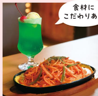
ポイント 食材に こだわりあり

@cafe._miki MAP | 裏表紙・D-7 瀬戸市大坪町215-4 ☎ 0561-87-1555 ① 7:00~17:00 (L.O.16:00) ② 困無休 ③ 120席 ④ 当日まで予約可(※混み具合でお断りする場合があります) ⑤ 40台 ⑥ 現金・クレジットカード・バーコード決済・交通系ICカード