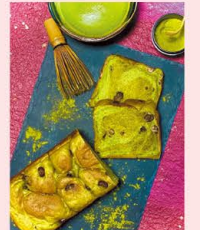
季節限定のパンに出会えることも

素材にとことんこだわった高級食パン専門店ながら、モーニングも大人気のお店。ドリンク代だけでいただけるお得なホットドッグセットは、パンからはみ出すほどのソーセージが食べ応え抜群!