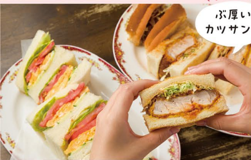
ポイント ぶ厚い カツサンド

早朝から常連さんが訪れる、昔ながらの喫茶店。名物はボリューム満点の「カツサンド」で、子どもからお年寄りまで大人気!平日限定の日替わり弁当もリーズナブルで大満足です。