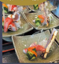
イチオシのカニコース タラバの刺身

MAP | 裏表紙・C-5 瀬戸市汗干町81-16 ☎ 0561-87-3921 🕒 11:30~14:00 (L.O.13:30) 17:30~21:00 (L.O.20:20) 困水 (火曜不定休) 鳥 約30席 曲 予約可 🚗 14台 🍷 現金のみ