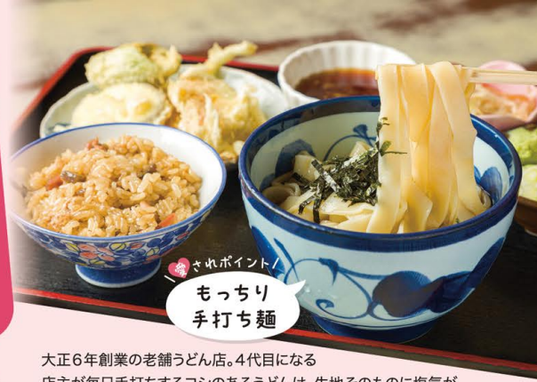
ポイント もちり 手打ち麺

大正6年創業の老舗うどん店。4代目になる店主が毎日手打ちするコシのあるうどんは、生地そのものに塩気が効いて、クセになる味わいです。ボリューム満点の「味噌煮込み」や自然薯たっぷりの「いもうどん」が人気。