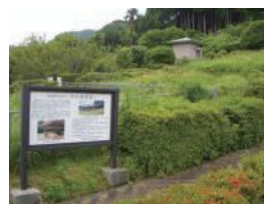
市の瀬皿山窯跡 (長崎県指定史跡)