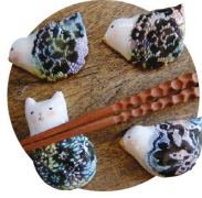
箸置き絵付け体験