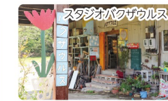
秘密基地のような ワクワクする工房で吹きガラス体験