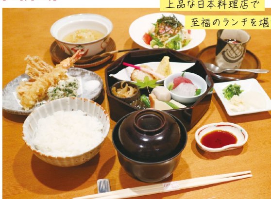
上品な日本料理店で 至福のランチを堪能