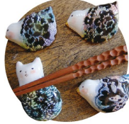
箸置き給付け体験