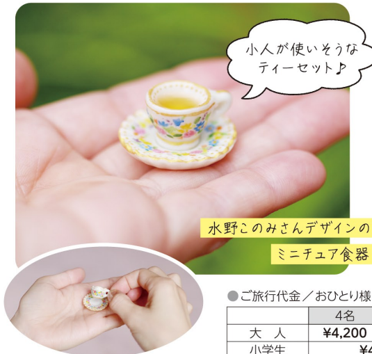
水野このみさんデザインの ミニチュア食器