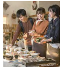
ゆるり秋の窯めぐり