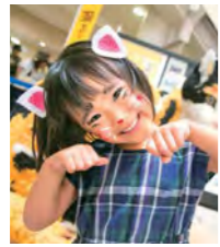
来る福招き猫まつり