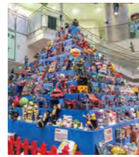
瀬戸蔵ロボット博 (3年に一度開催)